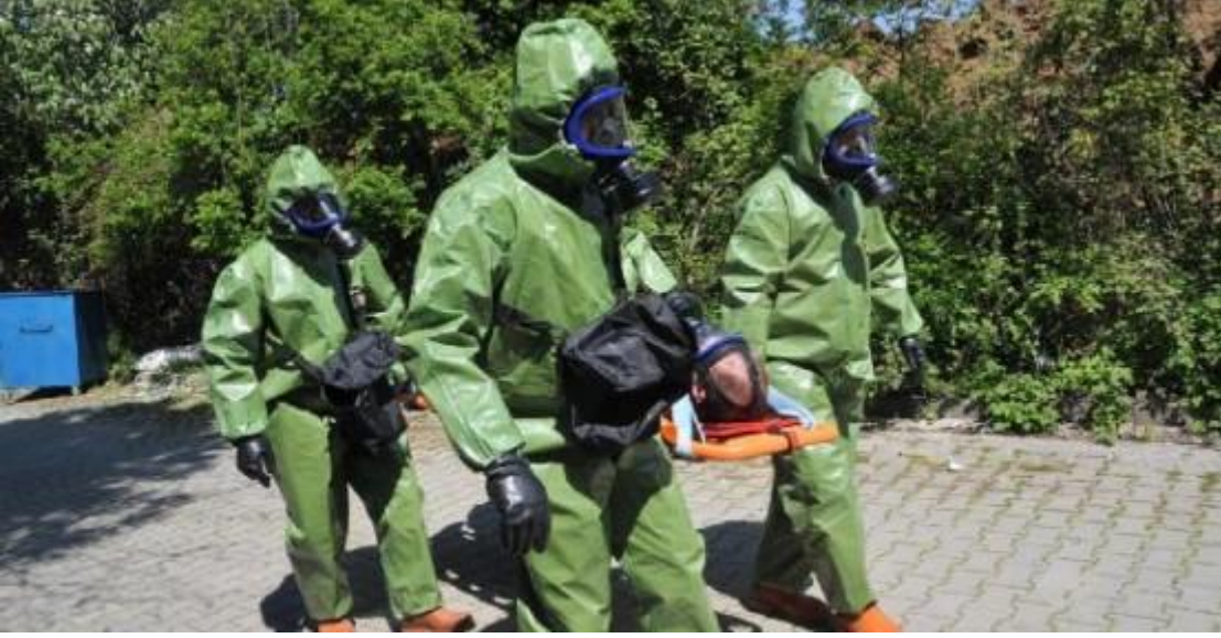
Yalova UMKE ve AFAD tarafından ortaklaşa "Endüstriyel Kazalarda Hastane Öncesi ve Hastanede Müdahale Eğitim Tatbikatı" düzenlendi.